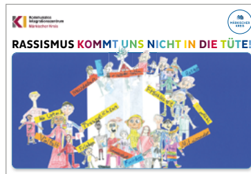
Klasse 4a, Förderschule Regenbogen-Schule Hemer