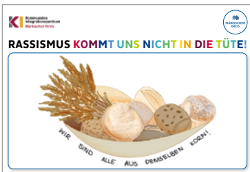
Nouralhouda, Schülerin der 9. Klasse, Gymnasium Letmathe